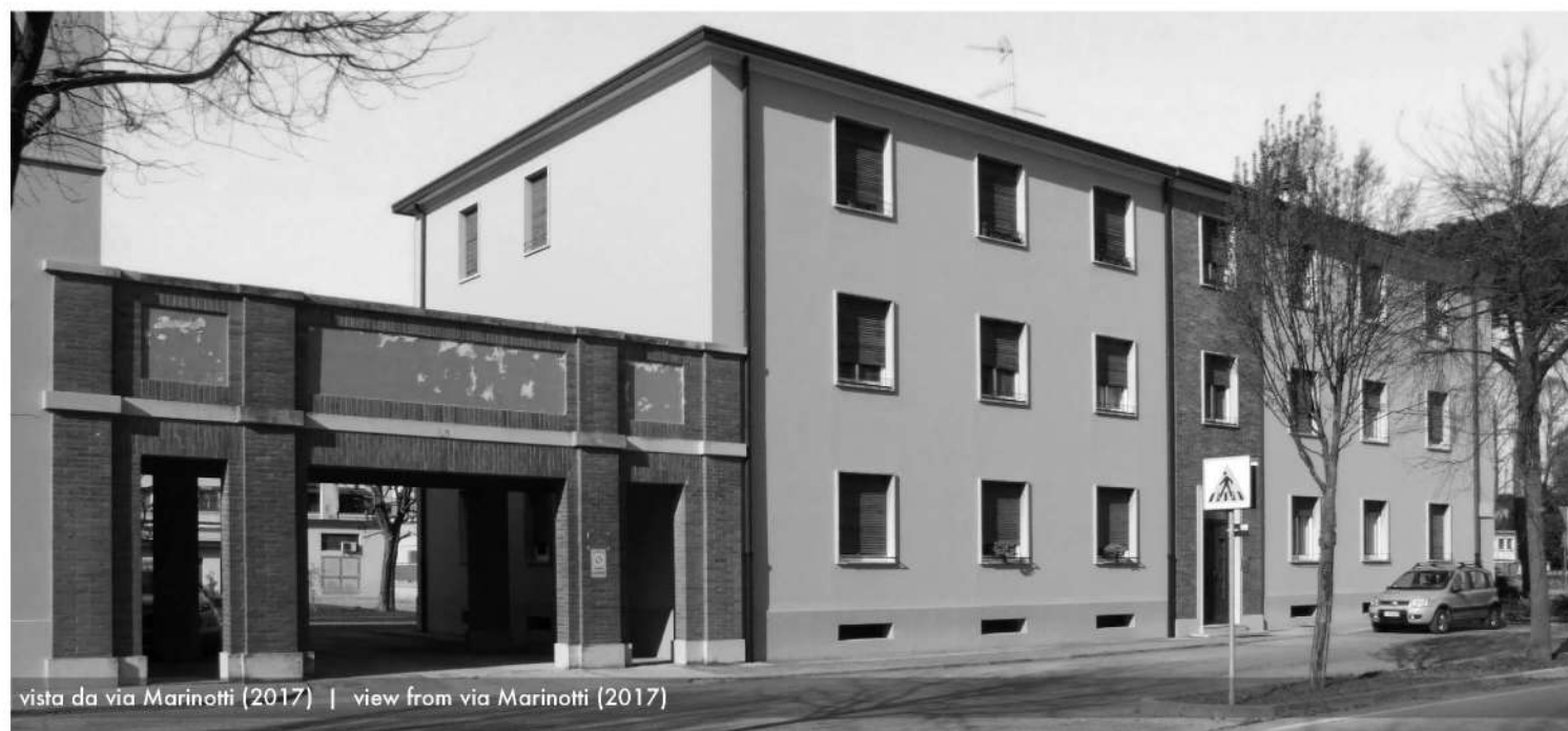
vista da via Marinotti (2017) | view from via Marinotti (2017)