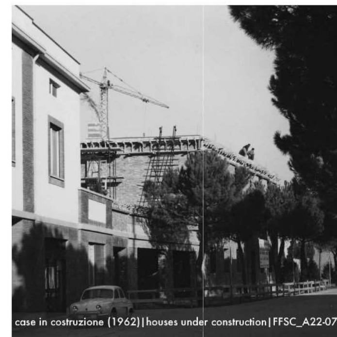
case in costruzione (1962) | houses under construction | FFSC_A22-075