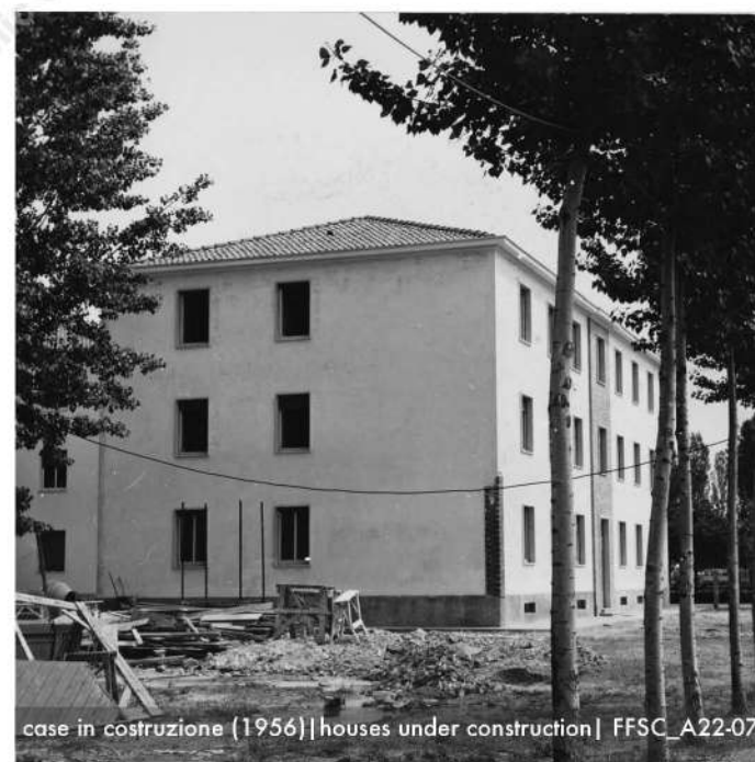
case in costruzione (1956) | houses under construction | FFSC_A22-070