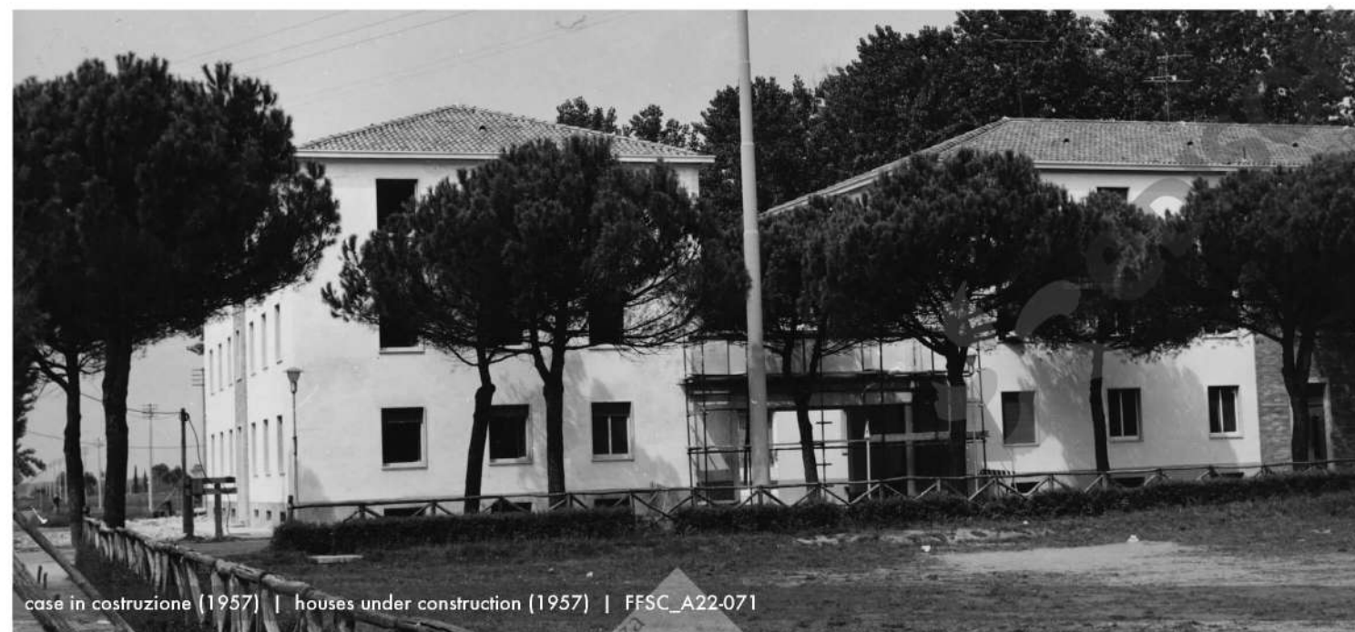
case in costruzione (1957) | houses under construction (1957) | FFSC_A22-071