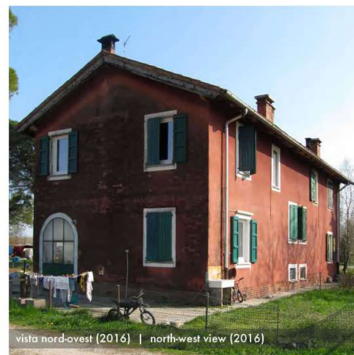
vista nord-ovest (2016) | north-west view (2016)