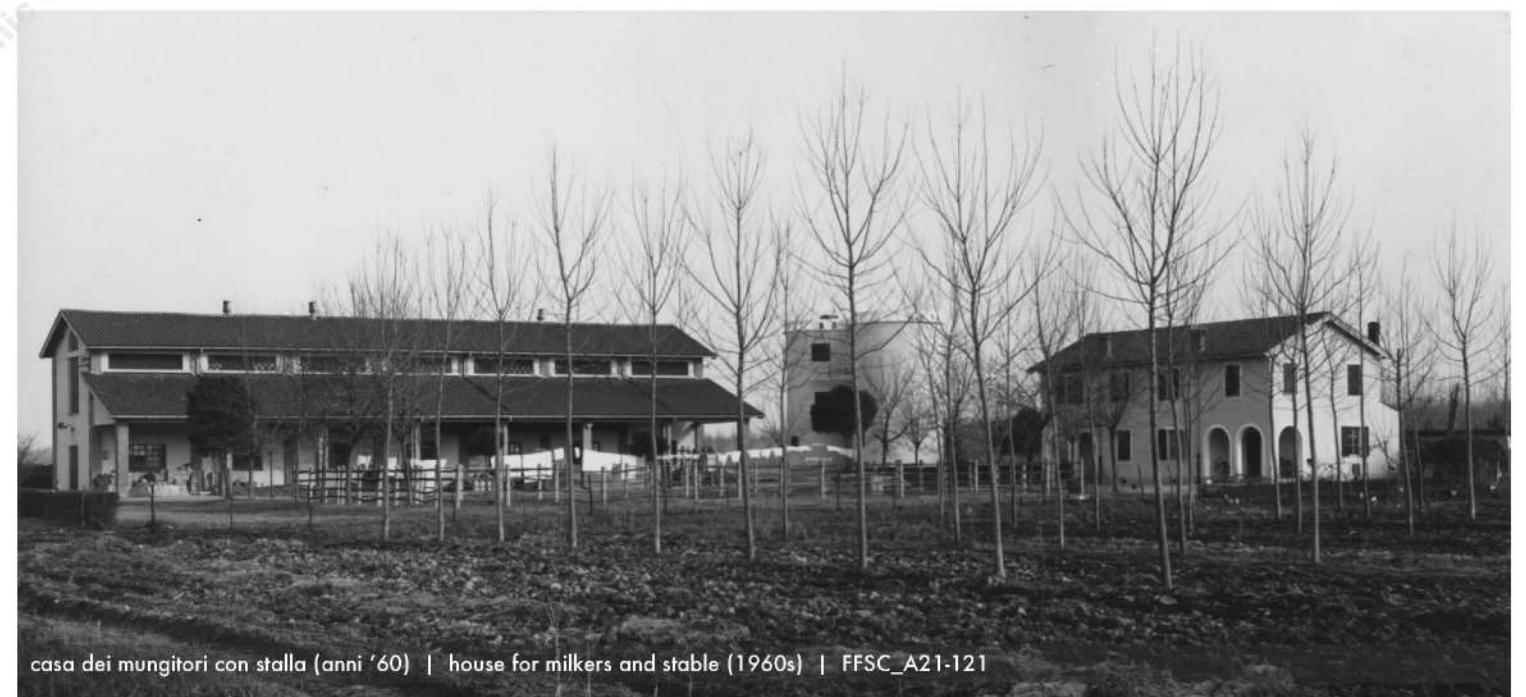
casa dei mungitori con stalla (anni '60) | house for milkers and stable (1960s) | FFSC_A21-121