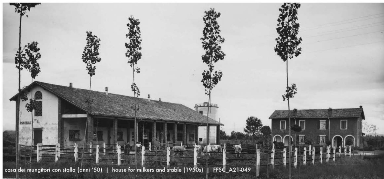
casa dei mungitori con stalla (anni '50) | house for milkers and stable (1950s) | FFSC_A21-049