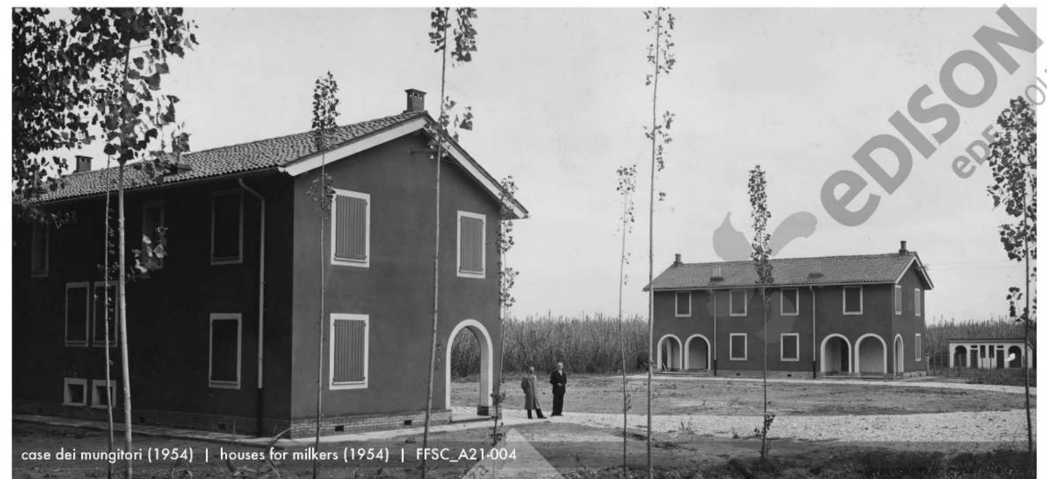
case dei mungitori (1954) | houses for milkers (1954) | FFSC_A21-004