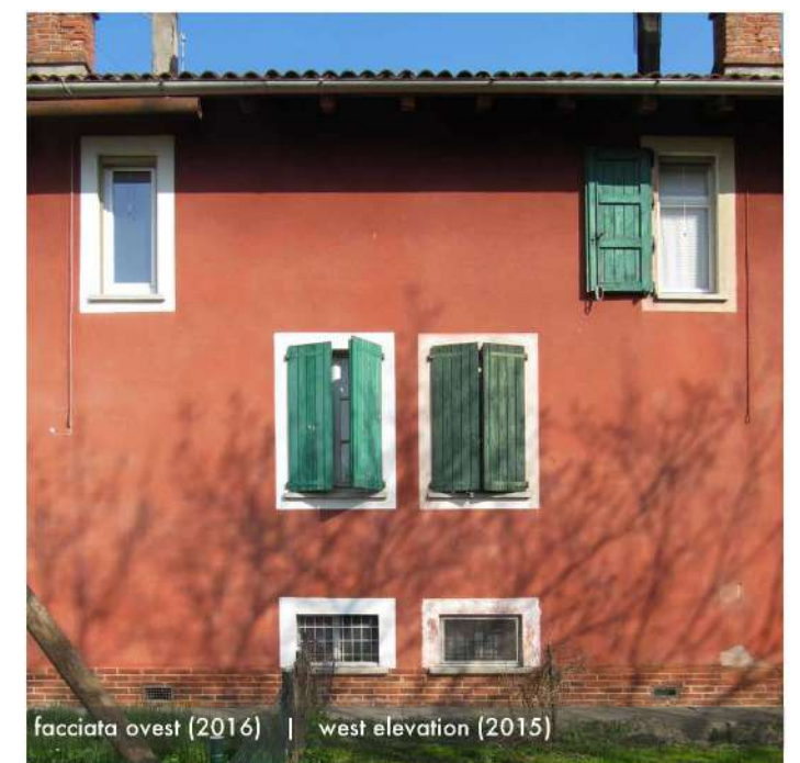
facciata ovest (2016) | west elevation (2016)