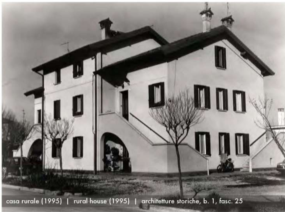
casa rurale (1995) | rural house (1995) | architetture storiche, b. 1, fasc. 25