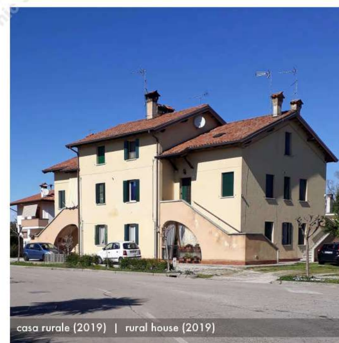
casa rurale (2019) | rural house (2019)