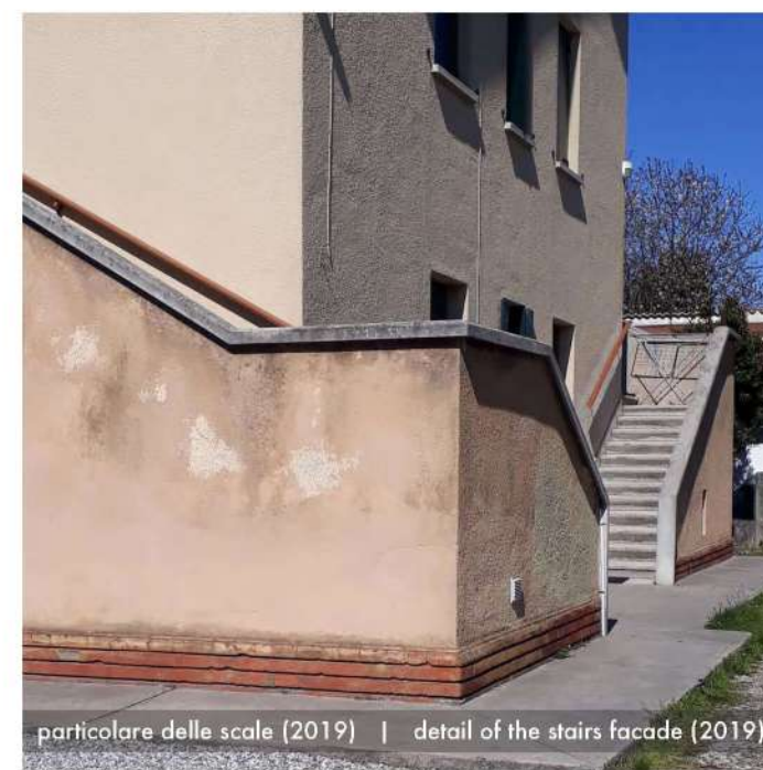
particolare delle scale (2019) | detail of the stairs facade (2019)