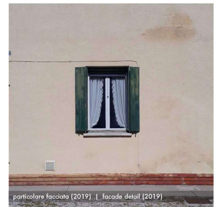
particolare facciata (2019) | facade detail (2019)