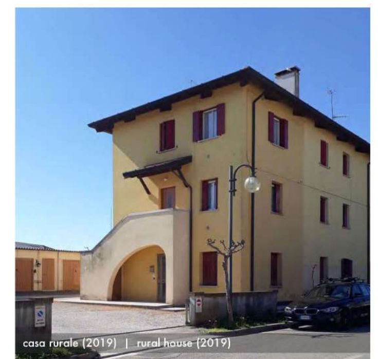
casa rurale (2019) | rural house (2019)