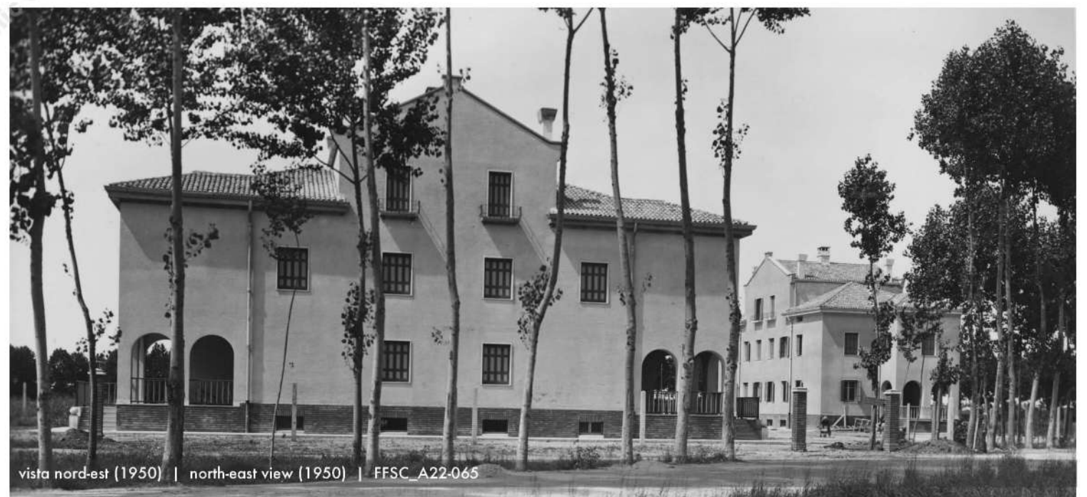
vista nord-est (1950) | north-east view (1950) | FFSC_A22-065