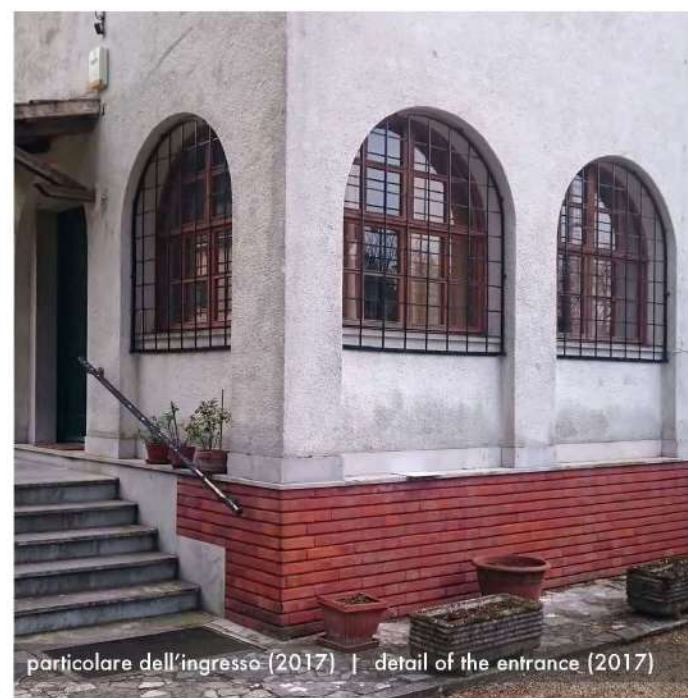
particolare dell'ingresso (2017) | detail of the entrance (2017)