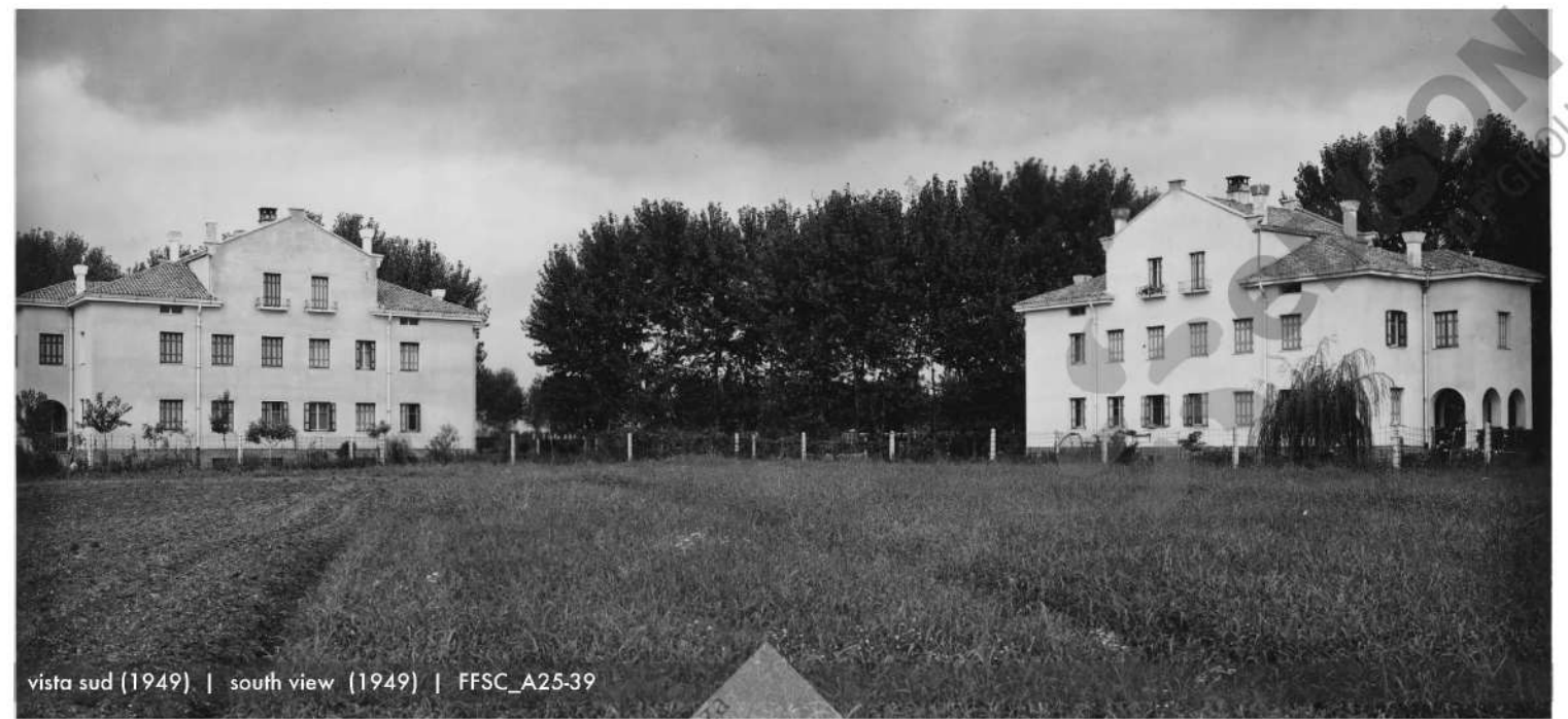
vista sud (1949) | south view (1949) | FFSC_A25-39