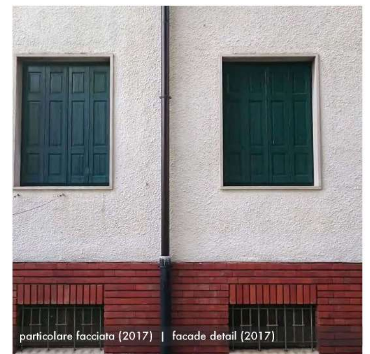
particolare facciata (2017) | facade detail (2017)