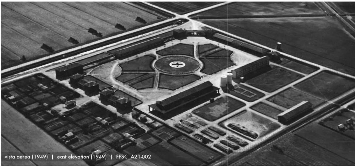
vista aerea (1949) | east elevation (1949) | FFSC_A21-002