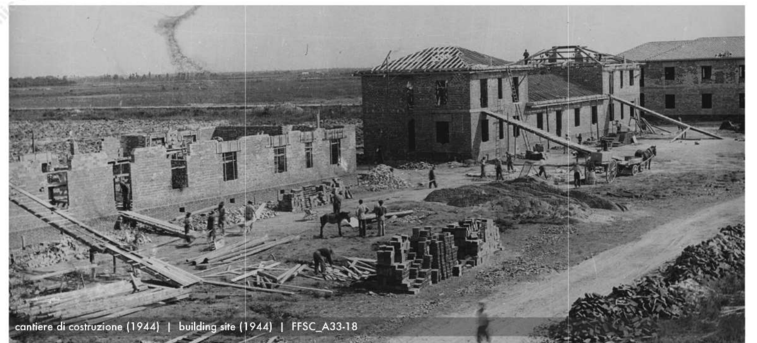
cantiere di costruzione (1944) | building site (1944) | FFSC_A33-18