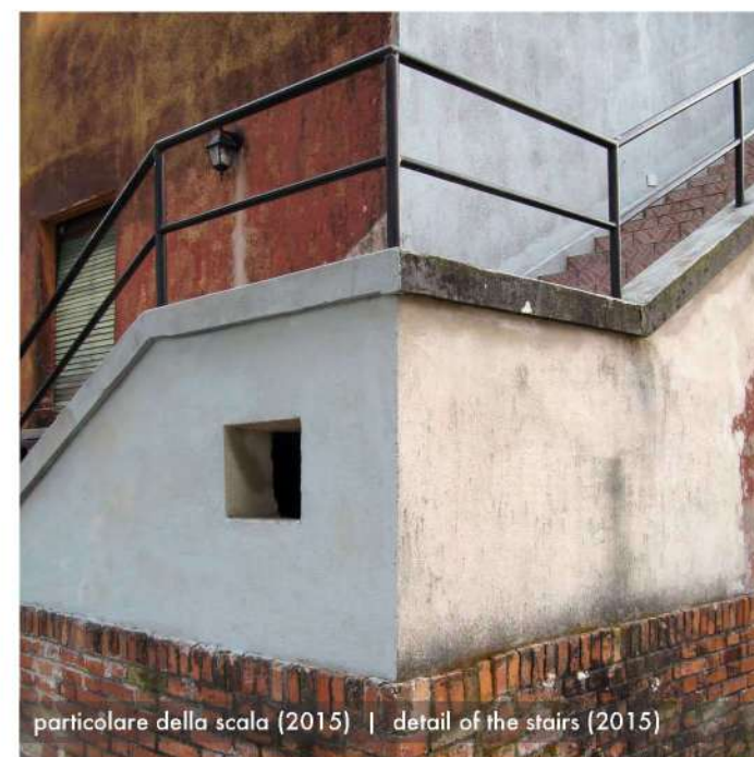
particolare della scala (2015) | detail of the stairs (2015)