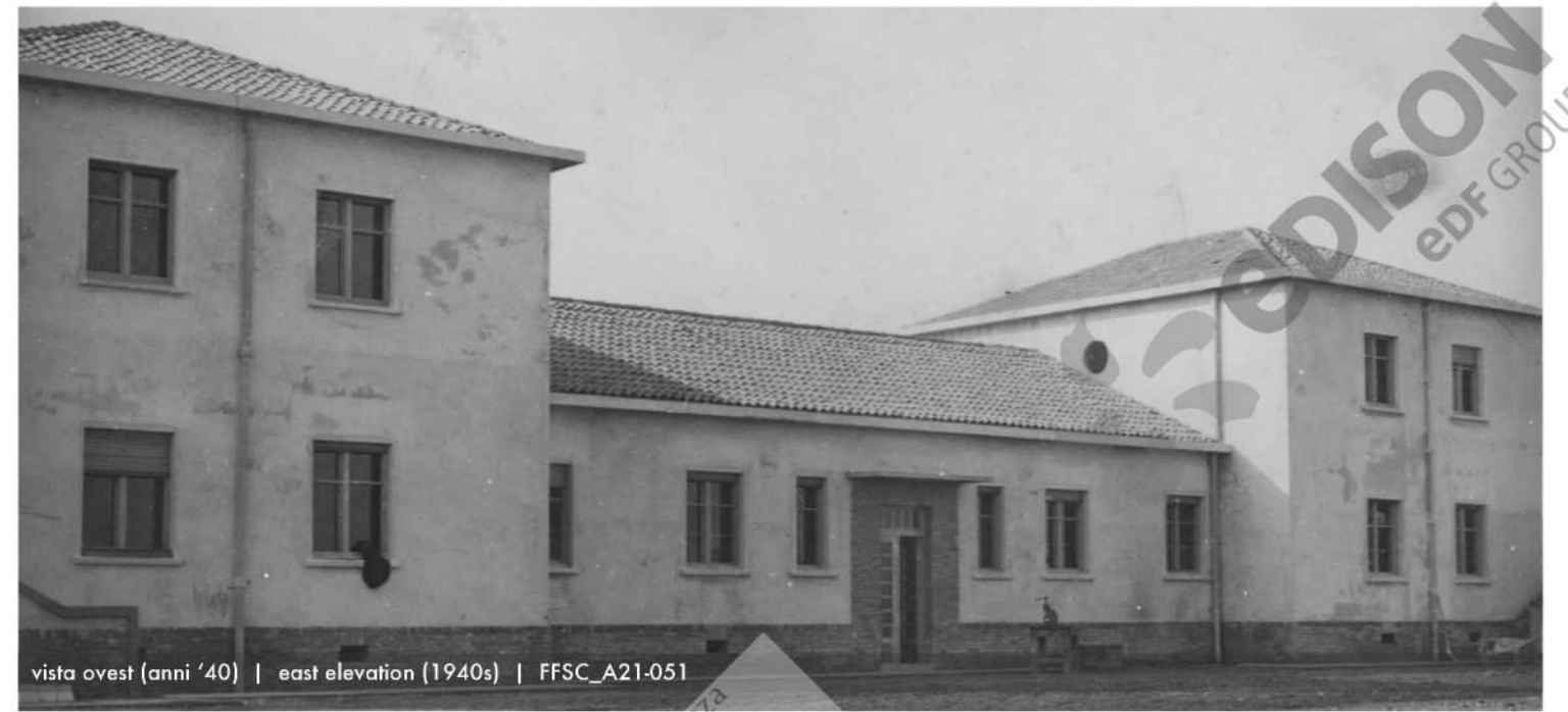
vista ovest (anni '40) | east elevation (1940s) | FFSC_A21-051