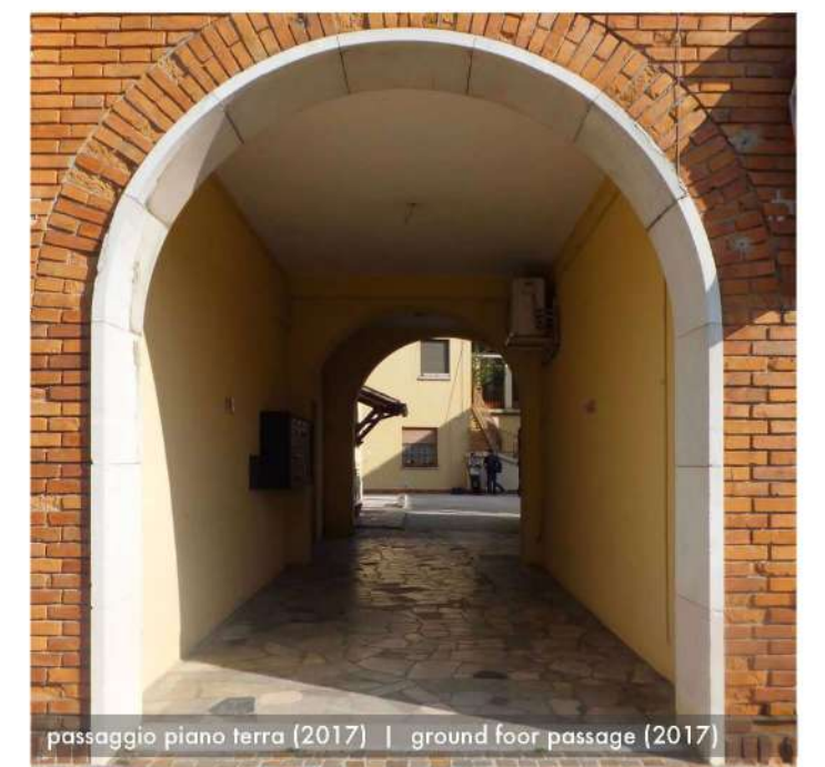
passaggio piano terra (2017) | ground floor passage (2017)