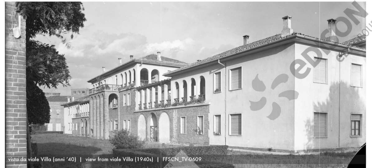
vista da viale Villa (anni '40) | view from viale Villa (1940s) | FFSCN_TV-0609