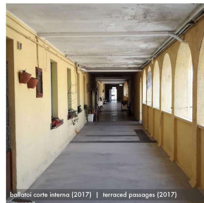
ballatoi corte interna (2017) | terraced passages (2017)