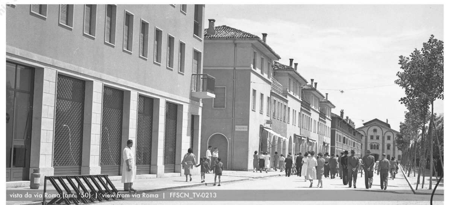
vista da via Roma (anni '50) | view from via Roma | FFSCN_TV-0213