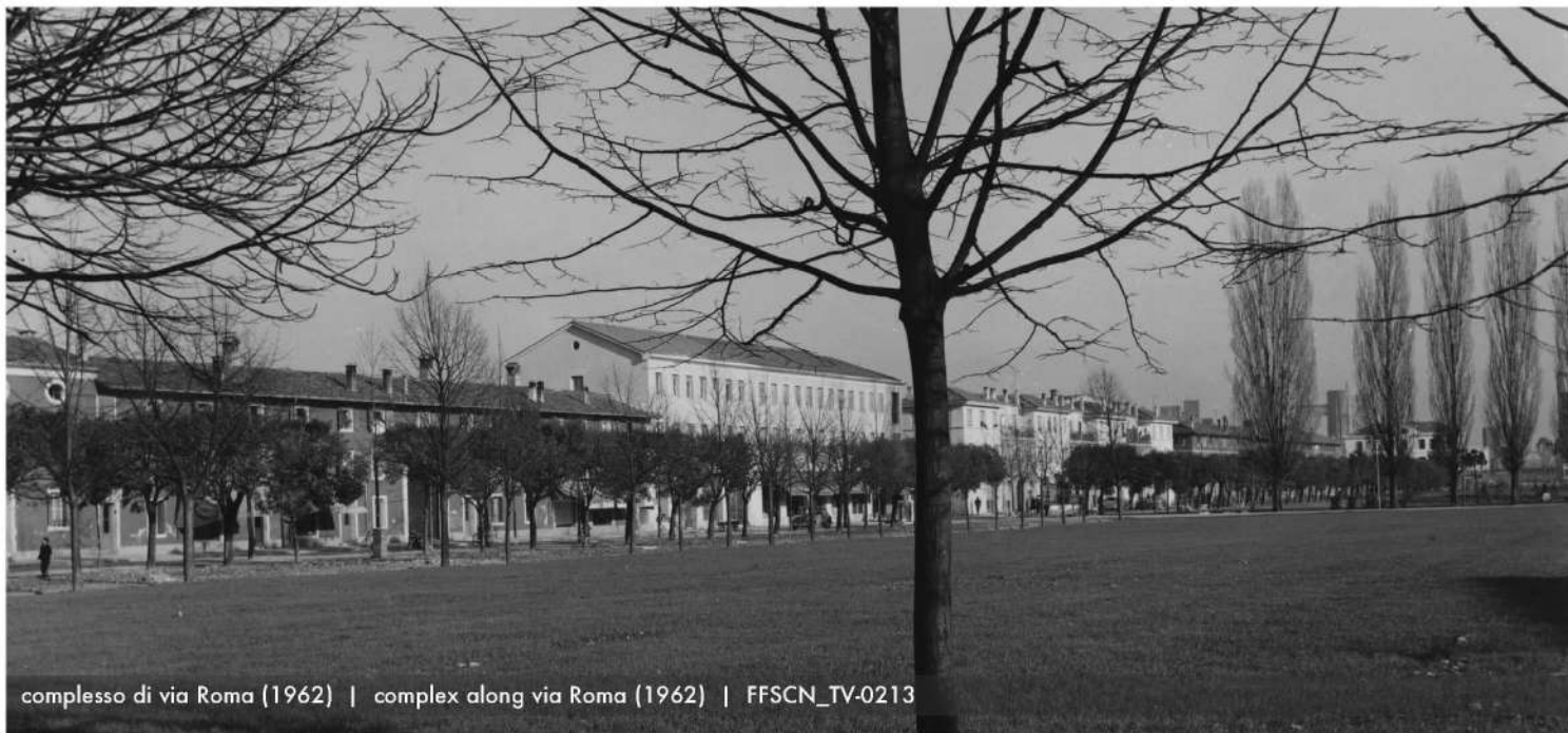
complesso di via Roma (1962) | complex along via Roma (1962) | FFSCN_TV-0213