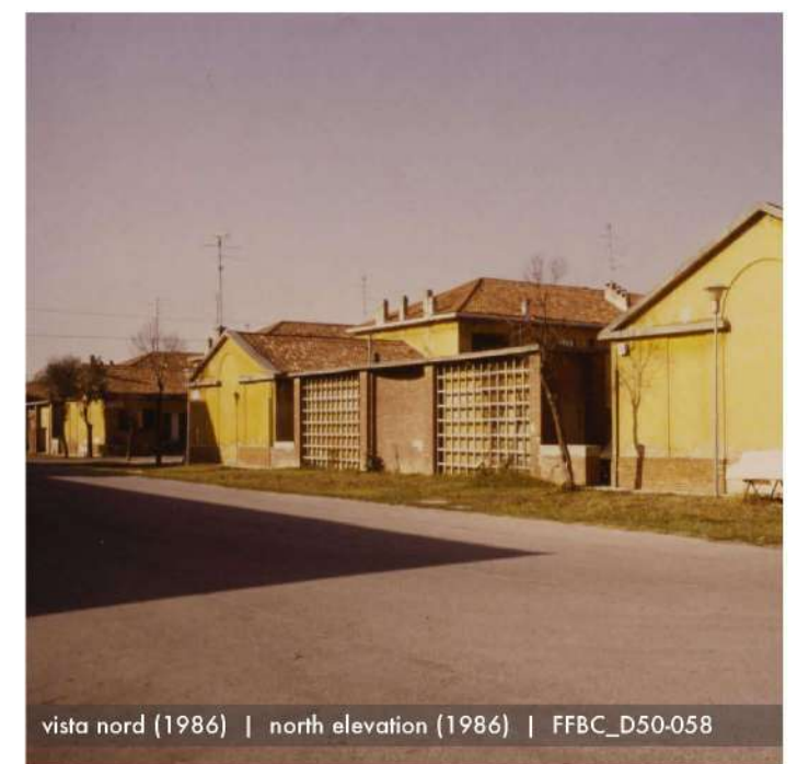
vista nord (1986) | north elevation (1986) | FFBC_D50-058