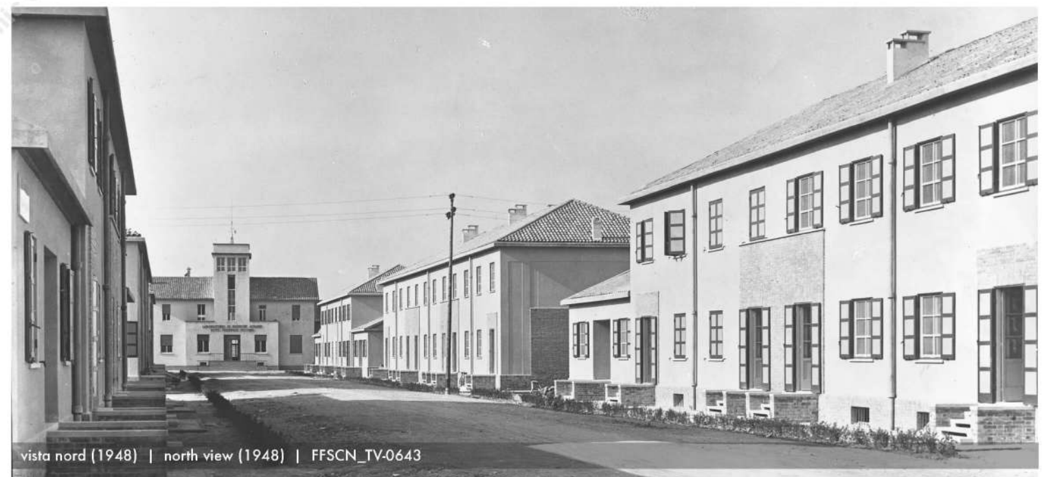
vista nord (1948) | north view (1948) | FFSCN_TV-0643