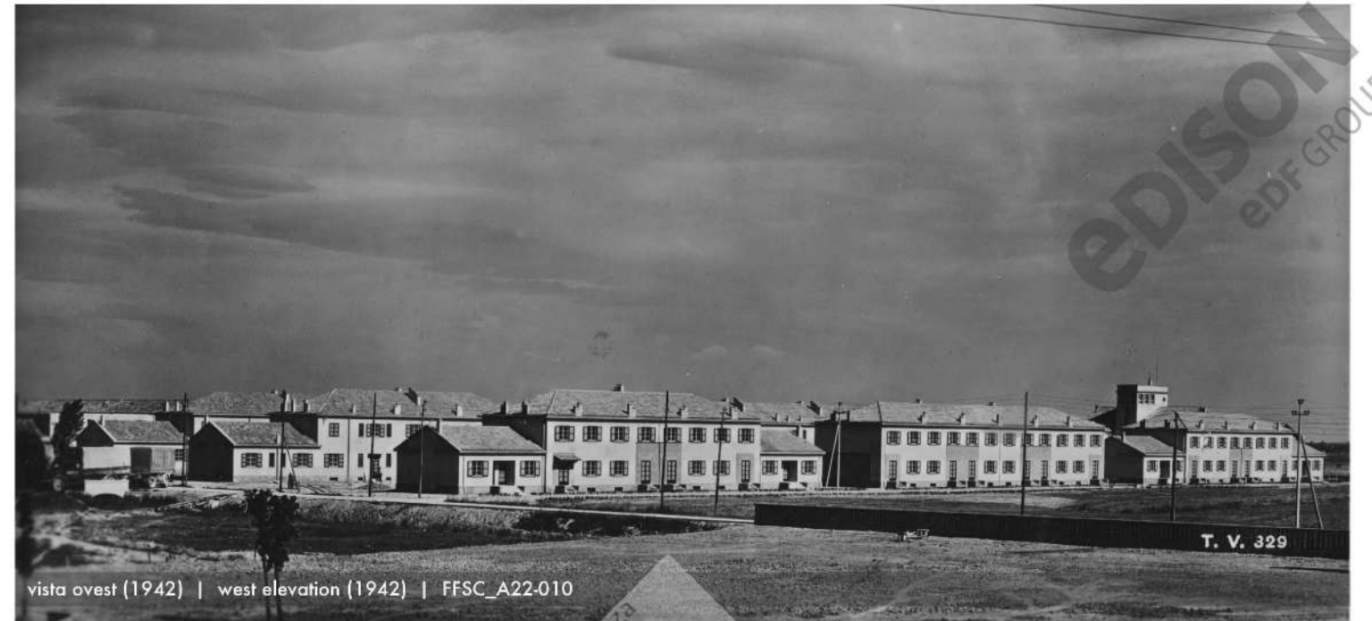
vista ovest (1942) | west elevation (1942) | FFSC_A22-010