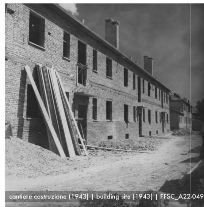
cantiere costruzione (1943) | building site (1943) | FFSC_A22-049