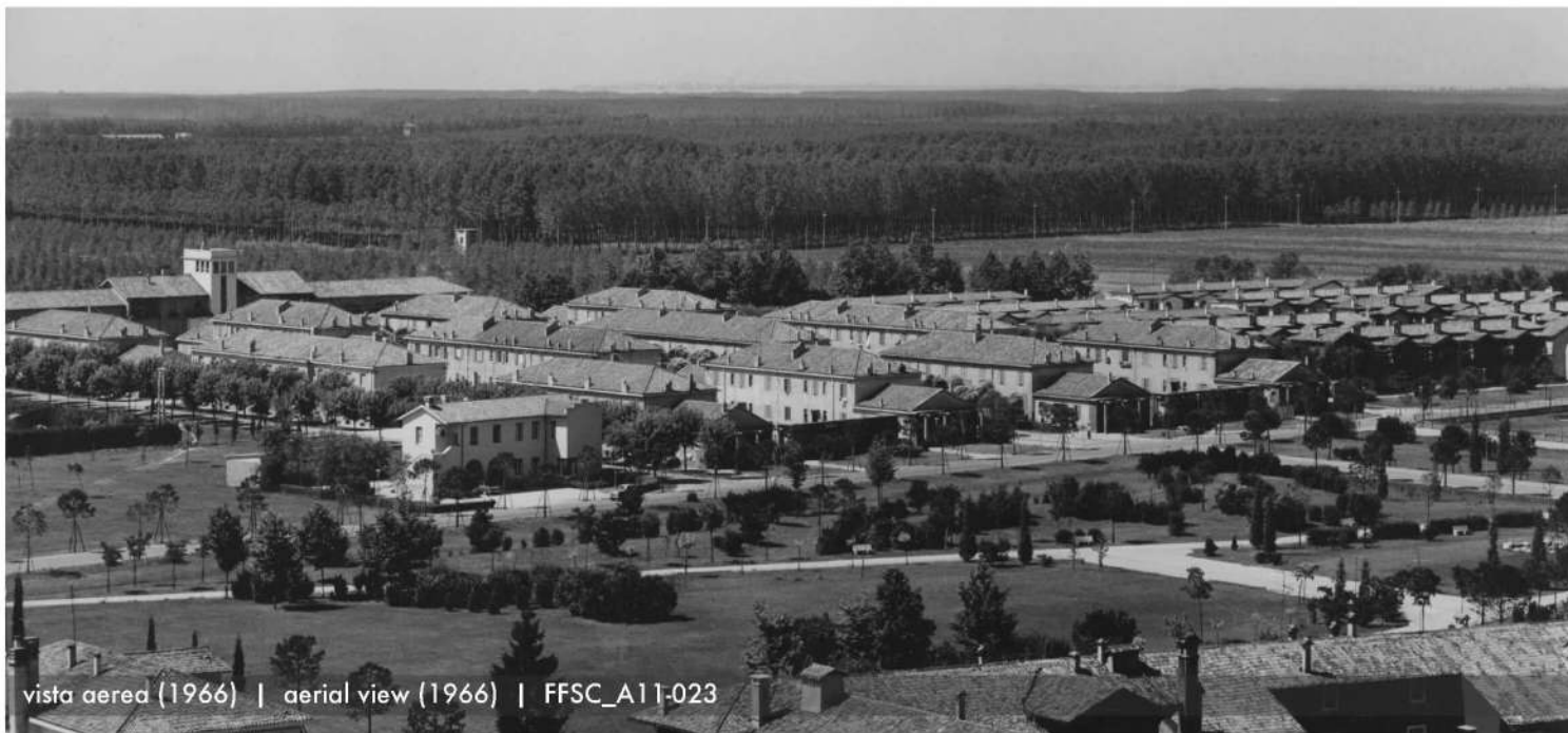
vista aerea (1966) | aerial view (1966) | FFSC_A11-023