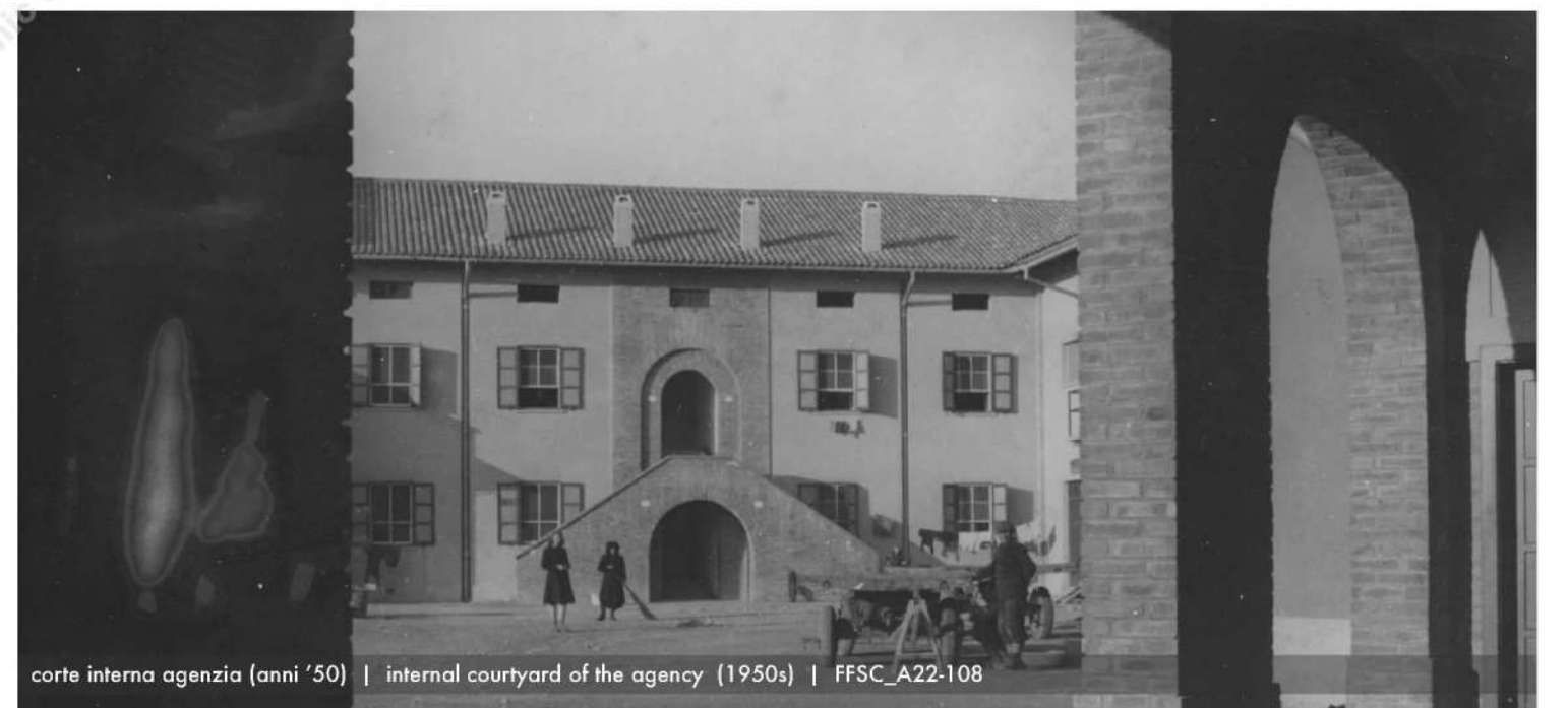
corte interna agenzia (anni '50) | internal courtyard of the agency (1950s) | FFSC_A22-108