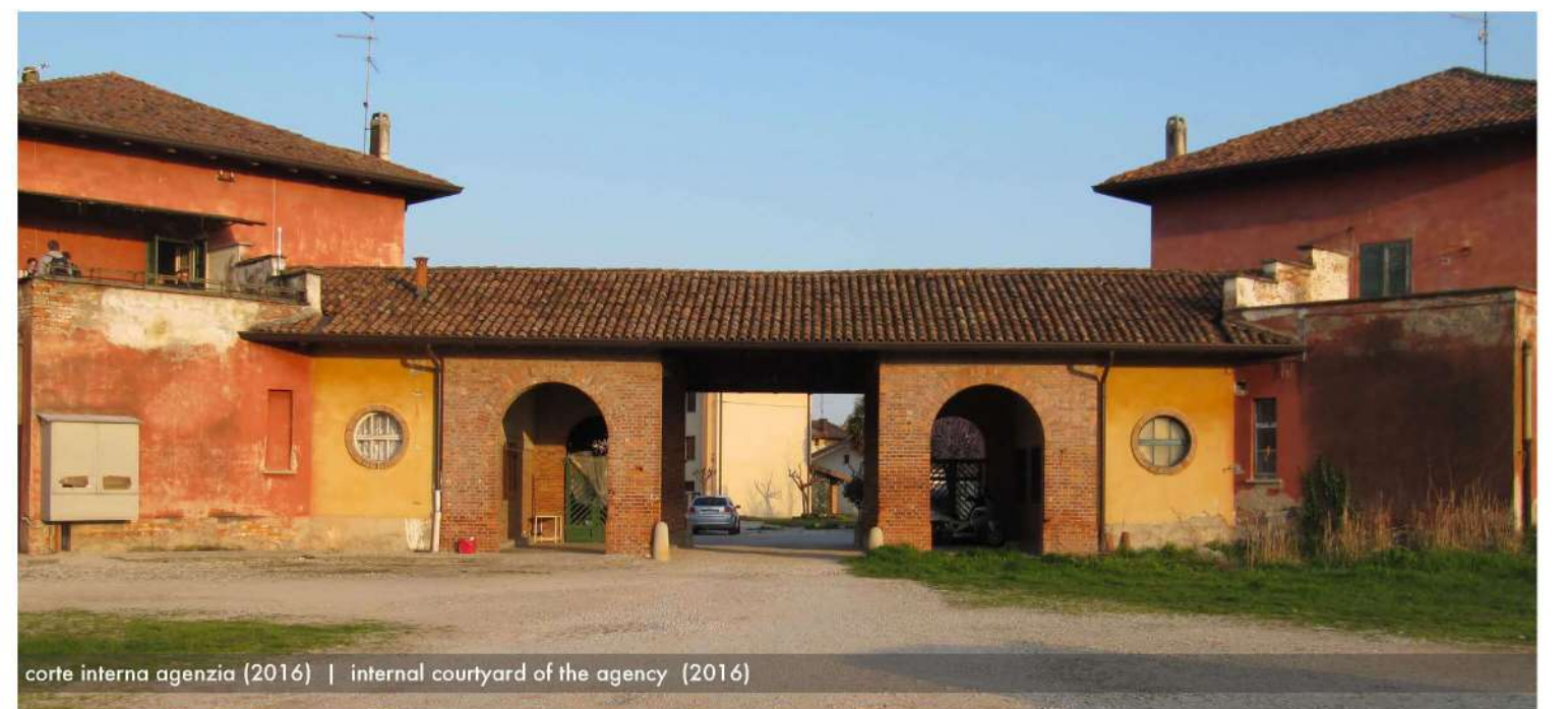
corte interna agenzia (2016) | internal courtyard of the agency (2016)