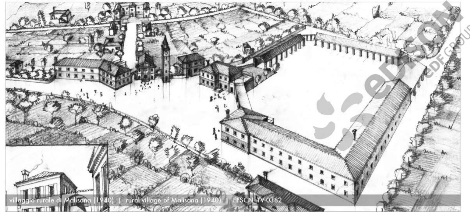
villaggio rurale di Malisana (1940) | rural village of Malisana (1940) | FFSCN_TV-0382