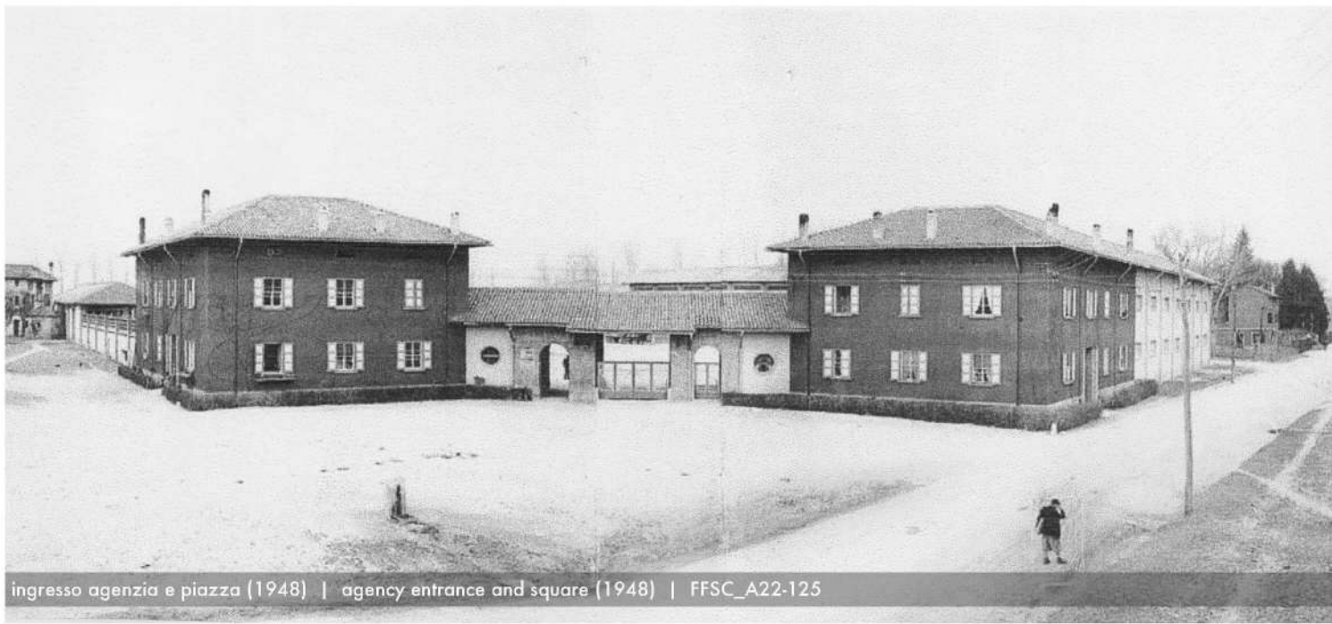
ingresso agenzia e piazza (1948) | agency entrance and square (1948) | FFSC_A22-125