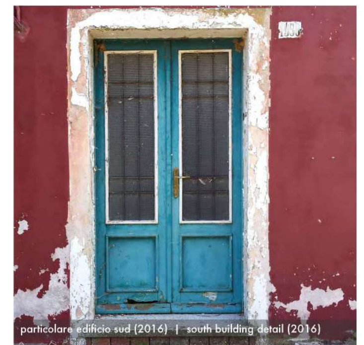
particolare edificio sud (2016) | south building detail (2016)