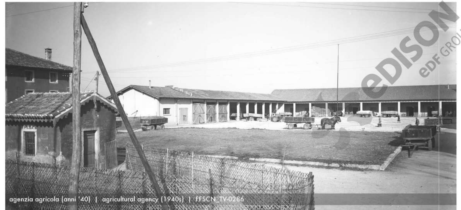
agenzia agricola (anni '40) | agricultural agency (1940s) | FFSCN_TV-0286