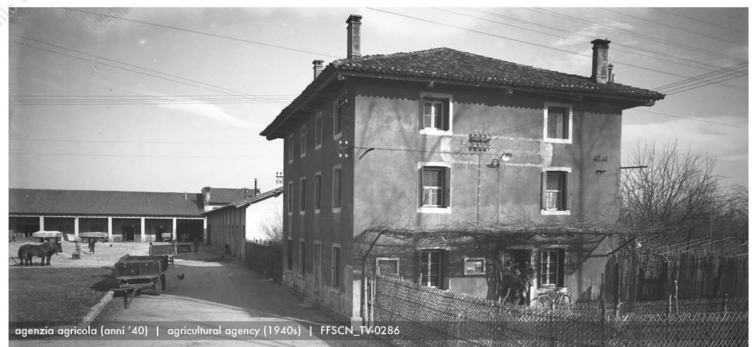
agenzia agricola (anni '40) | agricultural agency (1940s) | FFSCN_TV-0286