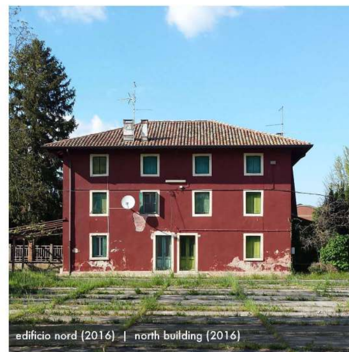
edificio nord (2016) | north building (2016)