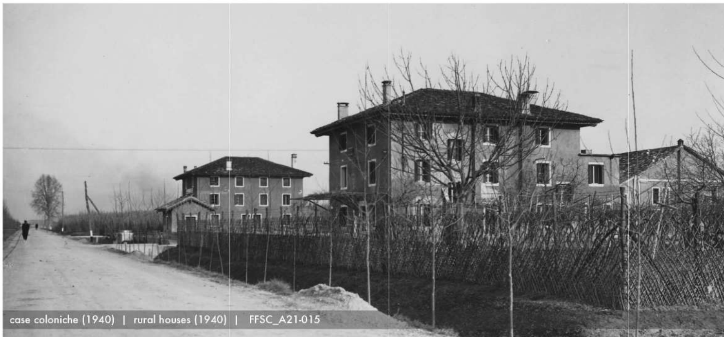
case coloniche (1940) | rural houses (1940) | FFSC_A21-015