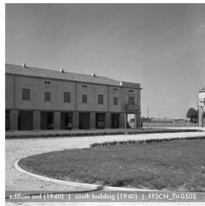
edificio sud (1940) | south building (1940) | FFSCN_TV-0502