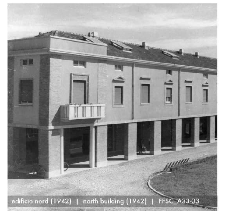
edificio nord (1942) | north building (1942) | FFSC_A33-03