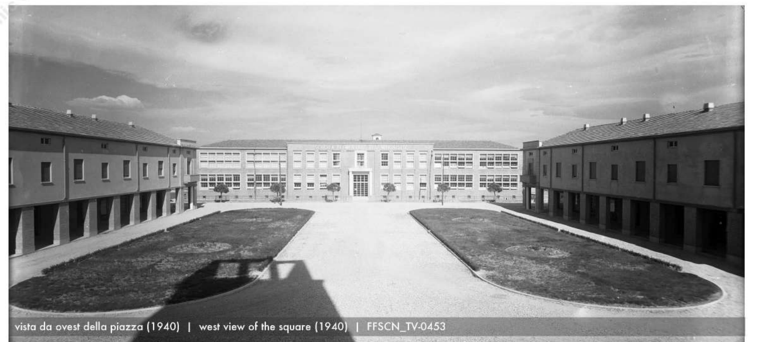
vista da ovest della piazza (1940) | west view of the square (1940) | FFSCN_TV-0453