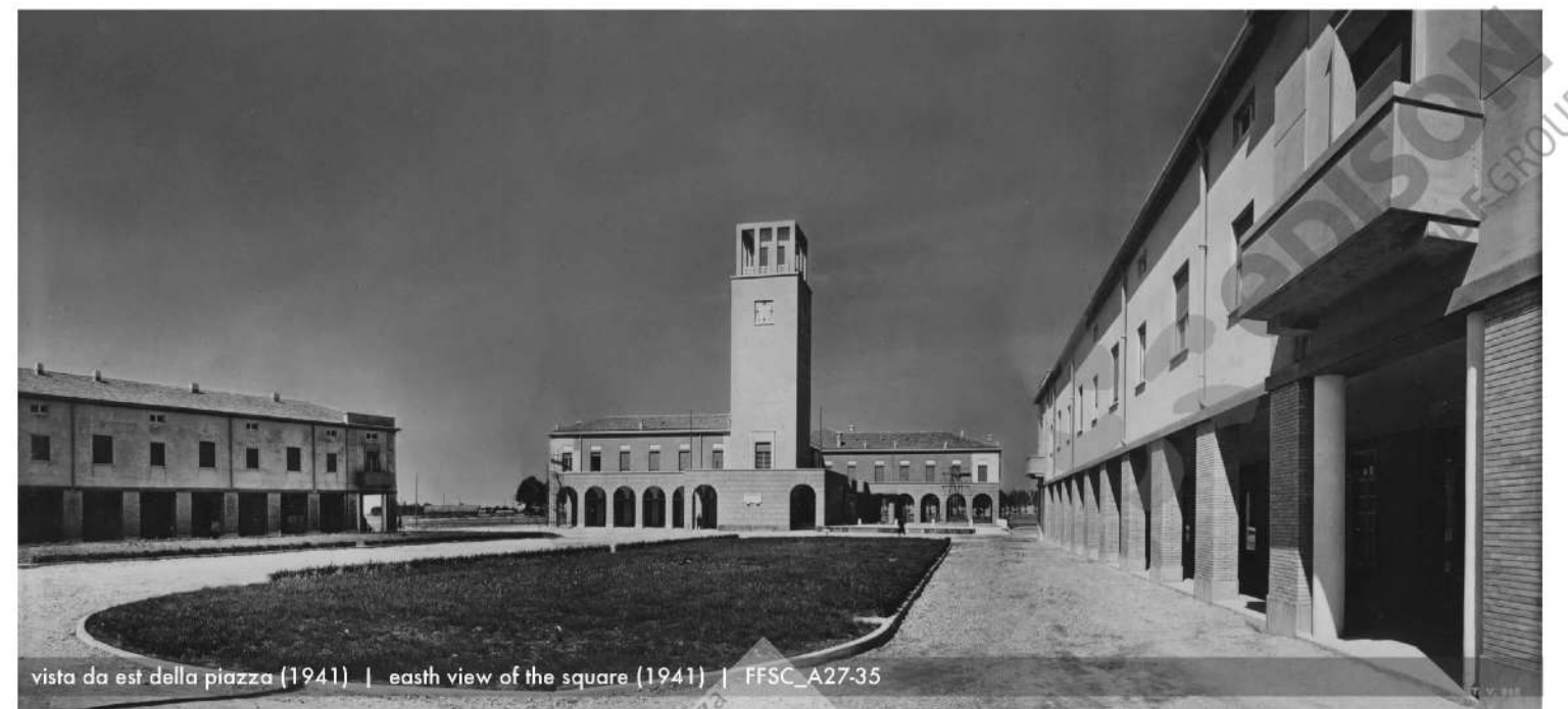
vista da est della piazza (1941) | east view of the square (1941) | FFSC_A27-35