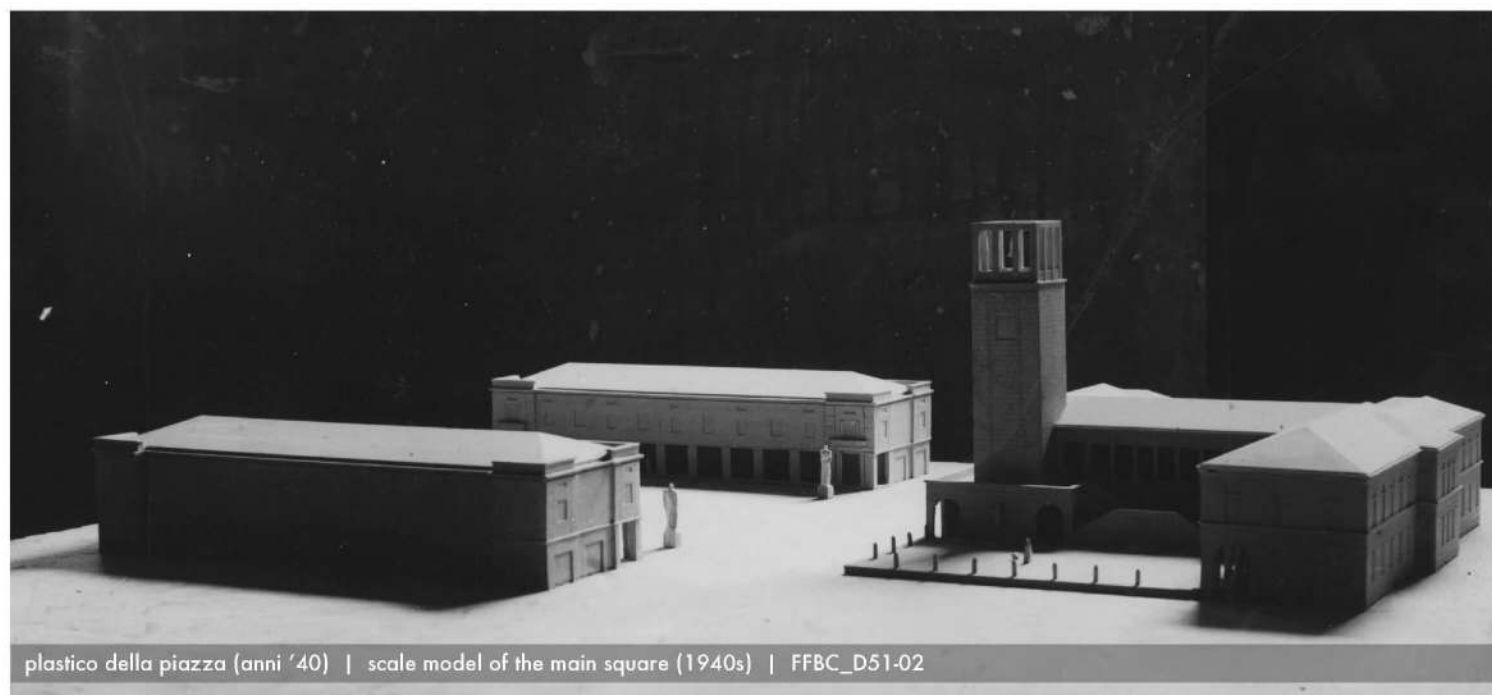
plastico della piazza (anni '40) | scale model of the main square (1940s) | FFBC_D51-02